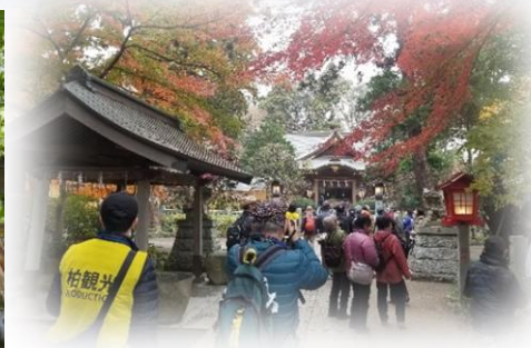
フットパスツアーのイメージ ※12/2 増尾地域フットパスツアーの様子