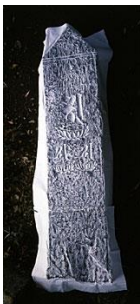
鎌倉時代末期に造立された阿弥陀様板碑