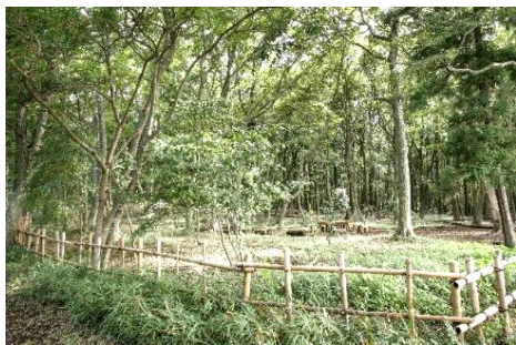
6～7世紀と思われる船戸古墳群