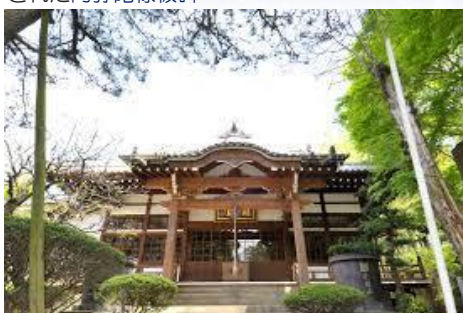
樹齢750年の大杉が見守る妙照寺